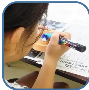
植木鉢に好きな絵を 描いていきます