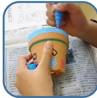
どんな色に塗ろうか な?迷いますね。