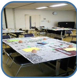
開始前の様子。材料 や道具の準備OK!