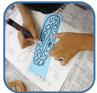
鳴らす紙にも絵を描 いていきます。