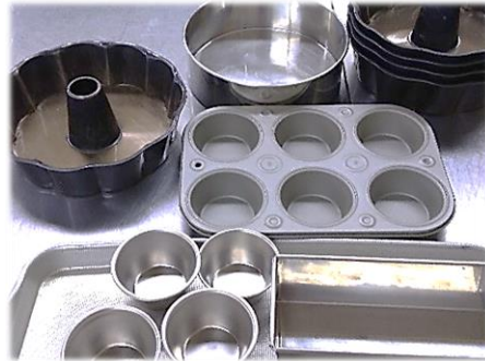
パウンドやホールなどさまざまなケーキ型