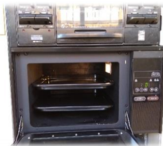
ガスオーブンが5台あります