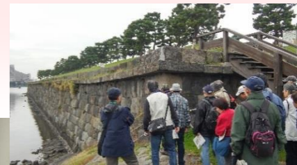
東京近郊の史跡めぐり お台場跡