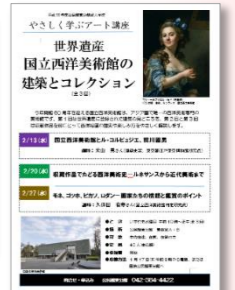
やさしく学ぶアート講座 国立西洋美術館