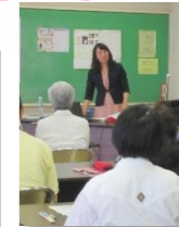
インドネシアとタイ王国の文化