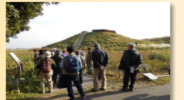
野外研修 さきたま古墳群