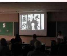
ニュース映画に見る昭和史 パート5 1961-1969年