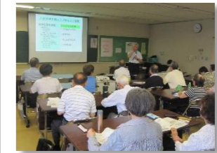
生活習慣病を防ぎ健康長寿!