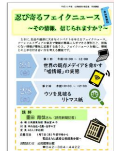
忍び寄るフェイクニュース