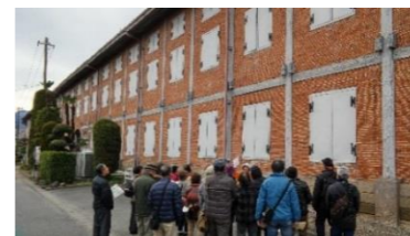
世界遺産を知る 富岡製糸場

男女共同参画講座 1月(全3回) 保育付き もう一度働きたい女性のためのステップアップ講座 ～再就職準備で素敵に自分磨き～