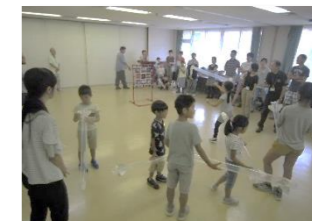
JAXAコズミックカレッジ 親子でバルーンロケットを飛ばそう