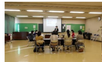
もう一度働きたい女性のための ステップアップ講座