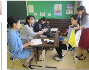
毎日をもっと輝くお洒落のヒント