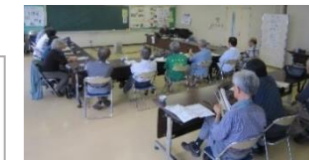
公民館の学びと役割について 考えてみませんか