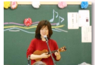
くちぶえファミリーコンサート