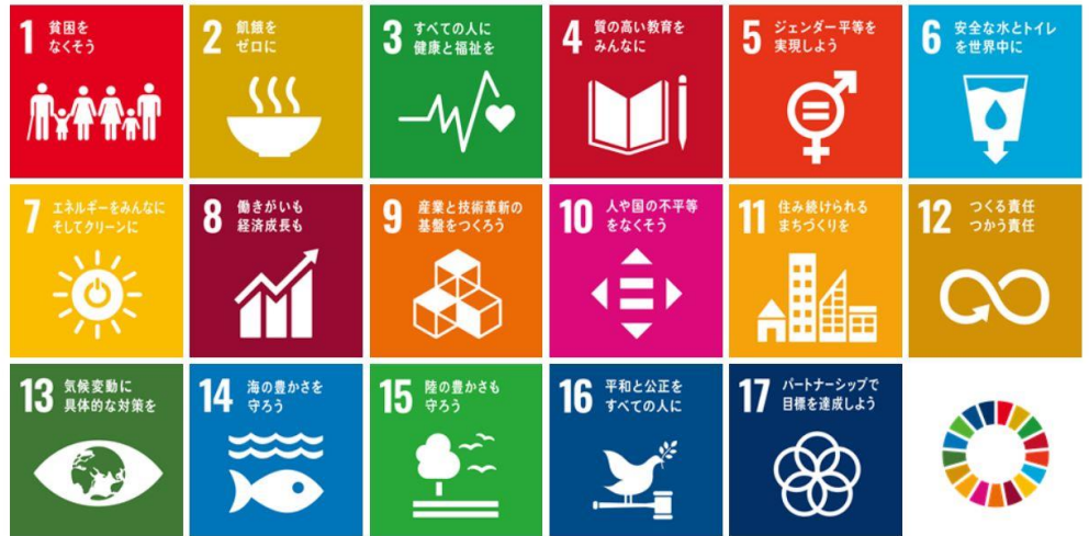
SDGs 世界を変えるための17の目標

目標は2030年までに、世界中の人が全員で協力して解決していくことですが、決して簡単なことではありません。