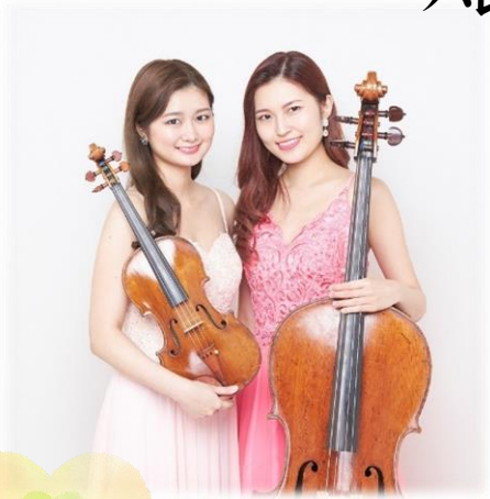
多方面で活躍中の「岡本姉妹」