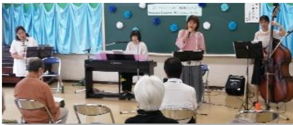
7月のジャズコンサート

9月以降の予定は以下の通りです。市長講話や野外研修など、興味深い講座が盛り沢山です。